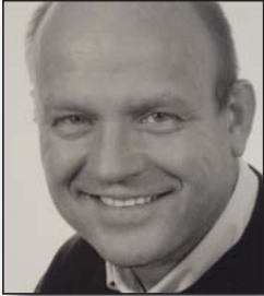
Die zweite Redaktionsmeinung von Marco Kolks

Optimizer-Technologie. Instrumentengruppen bei klassischen Einspielungen von Domenico Scarlatti oder Giachino Rossini (Burmester, Selection 1) bauen sich nachvollziehbarer auf. Sie wirken authentischer und haben ein